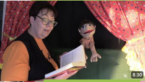
Poppekas en Kinderkerk

2023 was weereens 'n jaar waarop ons as NG Hulp en Hoop met groot dankbaarheid kan terugkyk en besef hoe geseënd hierdié gemeenste is. Wat 'n voorreg is dit nie om deel van 'n fantastiese groep mense te wees wat werklik omgee. Daarom kan ons Dankie-sê vir 'n jaar vol suksesse!!