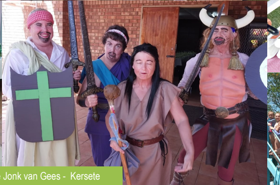
Aksie Jonk van Gees - Kersete