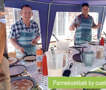
Pannekoekbak by ouetehuis